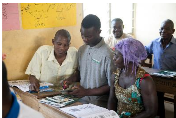
Use of calculator