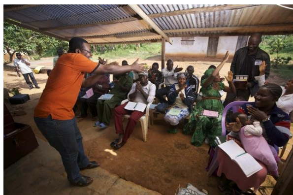
FBS in action Enthusiasm

480.000 producteurs et productrices de cacao en Côte d'Ivoire, au Ghana, au Cameroun, au Nigéria et au Togo ont participé aux formations FBS dans le cadre SSAB. Depuis 2012, 40 autres programmes de développement, leurs partenaires, les organisations nationales telles que l'Agence de transformation agricole de l'Éthiopie et 2 entreprises ont adapté FBS avec le soutien de SSAB pour 39 chaînes de valeur autres que le cacao. Au total, plus de 1.710.000 exploitants (34% de femmes) dans 25 pays africains ont suivi la formation FBS